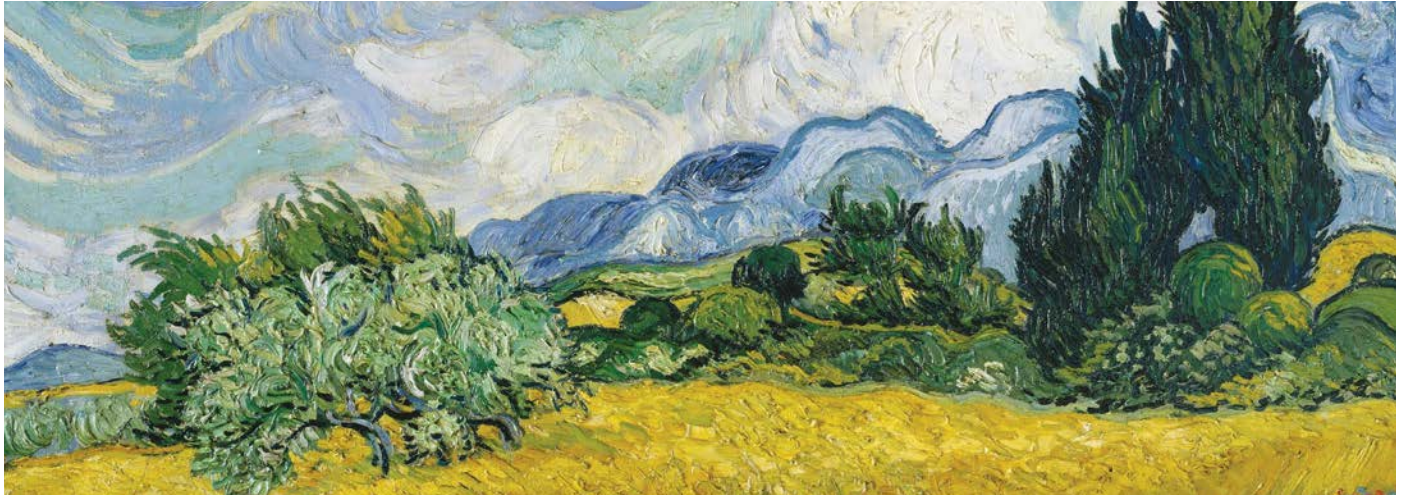
Vincent van Gogh, Champ de blé avec cyprès, 1889. Image publiée avec l'aimable autorisation du Metropolitan Museum of Art.